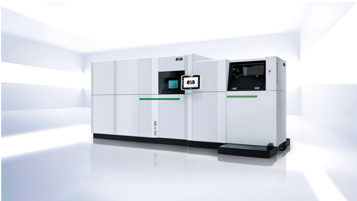
Η σειρά EOS M 300 για ψηφιακή AM βιομηχανική παραγωγή.